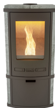
Torus Pellet Naturel