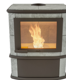
Grande Noblès Pellet Naturel