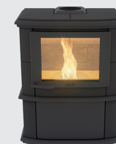
Noblès Pellet Uni Black