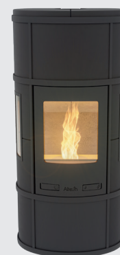
Ecosy Pellet Plus Uni Black