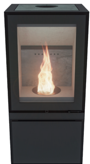
Max H Pellet Naturel