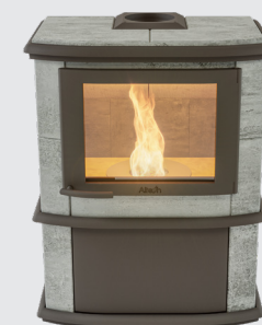
Noblès Pellet Naturel