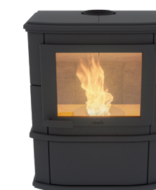
Grande Noblès Pellet Uni Black