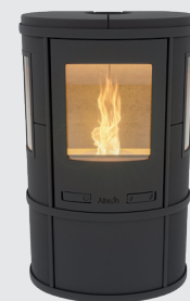
Ecosy Pellet Uni Black