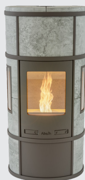
Ecosy Pellet Plus Naturel