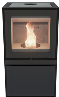
Max B Pellet Naturel