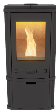
Torus Pellet Uni Black