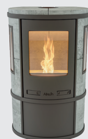
Ecosy Pellet Naturel